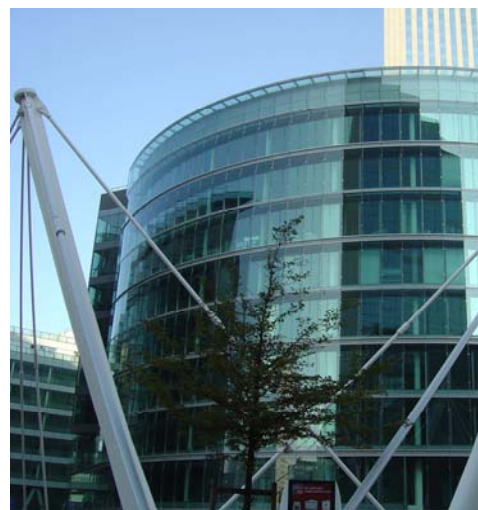
Le Siège d'Experian à Paris La Défense