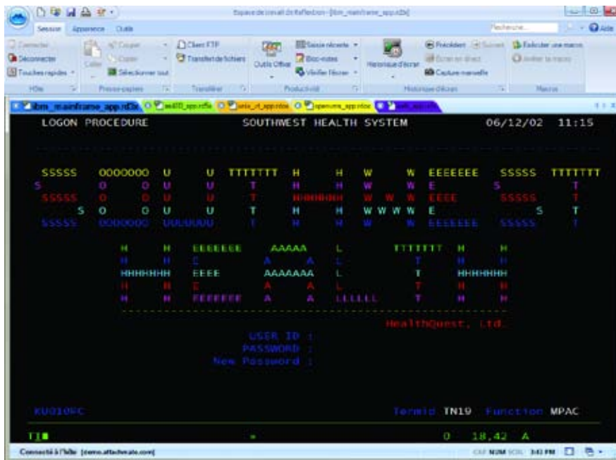
Reflection for IBM 2011 en mode interface multidocument avec onglets.

L'intégration à Office 2010 permet aux utilisateurs de copier les données d'hôte dans un document Word, un message électronique ou des diapositives PowerPoint en cliquant simplement sur un bouton. Par ailleurs, Reflection for IBM 2011 incorpore plusieurs fonctions, telles que la saisie semi-automatique, l'extension automatique, la vérification orthographique, le Bloc-notes, la saisie récente et l'historique d'écran, rendant ainsi les applications hôte aussi faciles à utiliser que les applications Office.